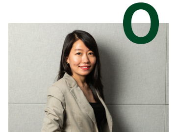
그 특별한 자부심과 가치의 중심에