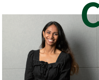
글로벌 리더를 양성합니다.