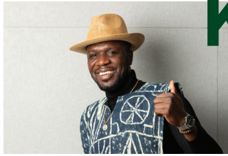
세상의 변화를 주도하는 글로벌 리더.