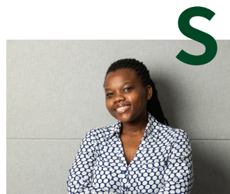
새로운 패러다임을 창조하는