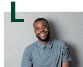
바로 여러분을 초대합니다.