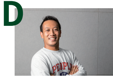
KDI School은 세계의 변화와 혁신,