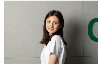
세계 최고의 정책전문대학원으로 거듭나는 KDI School,