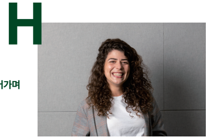
국제사회의 동반성장을 이끌어가며